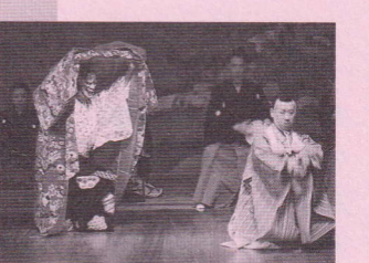
画像はこれまでの「青嶂会」より