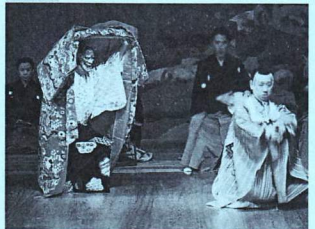
画像はこれまでの「青嶂会」より