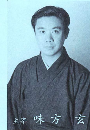
MIKATA / SHIZUKA